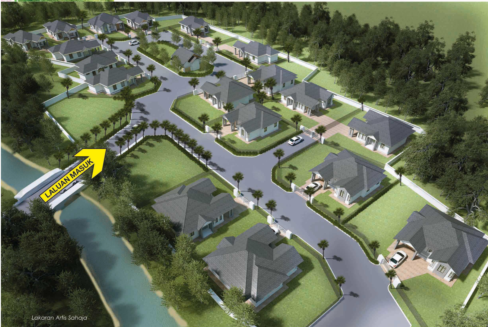
Lakaran Artis Sahaja

Konsep "GATED COMMUNITY" dengan satu laluan masuk