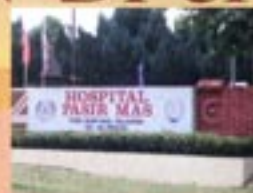
Hospital Pasir Mas