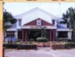
Kolej Kemahiran Tinggi Mara