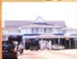
Kompleks Bebas Cukai R. Panjang

LOKASI YANG STRATEGIK BERHAMPIRAN PROJEK